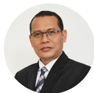
Agus Sudibyo, M.Stat. Kepala BPS Provinsi Jambi

Untuk informasi lebih lanjut silakan hubungi: